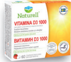
Naturell Vitamin D3